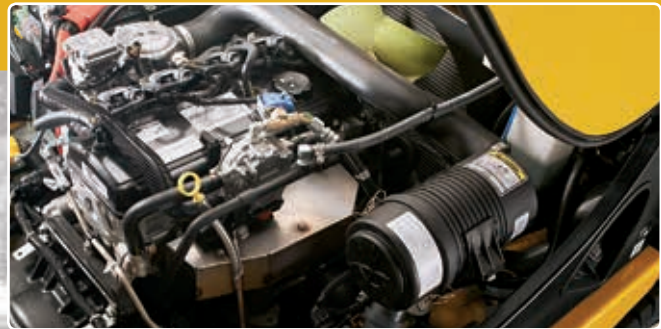
Motor PSI 2,4L

La serie MX incluye modos ajustables para producir un aumento adicional del rendimiento de la potencia en horas o temporadas pico o maximizar la economía de combustible para controlar los costos; lo que sea que su aplicación requiera, en tiempo real. Con la tecnología Flex Performance de Yale, el motor PSI 2.4l genera 62 caballos de potencia en el modo más alto, lo que le ofrece una aceleración y una velocidad de desplazamiento excepcionales.