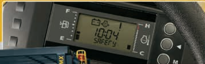
Pantalla integrada al tablero